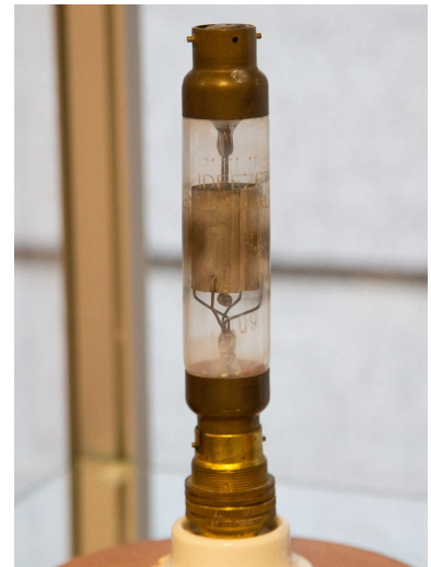
De Philips Ideezet Generator-lamp type G1 1921 6Volt bij 2,25 Amp, 500V anodespanning nader bekeken Zowel Ideezet en Generator- lamp staat op het glas. Een uniek exemplaar

Bovenste schap: Philips Ideezet Generatorlamp van Maarten Gudde, De Z3 en Z4 van Remco Vaassen.