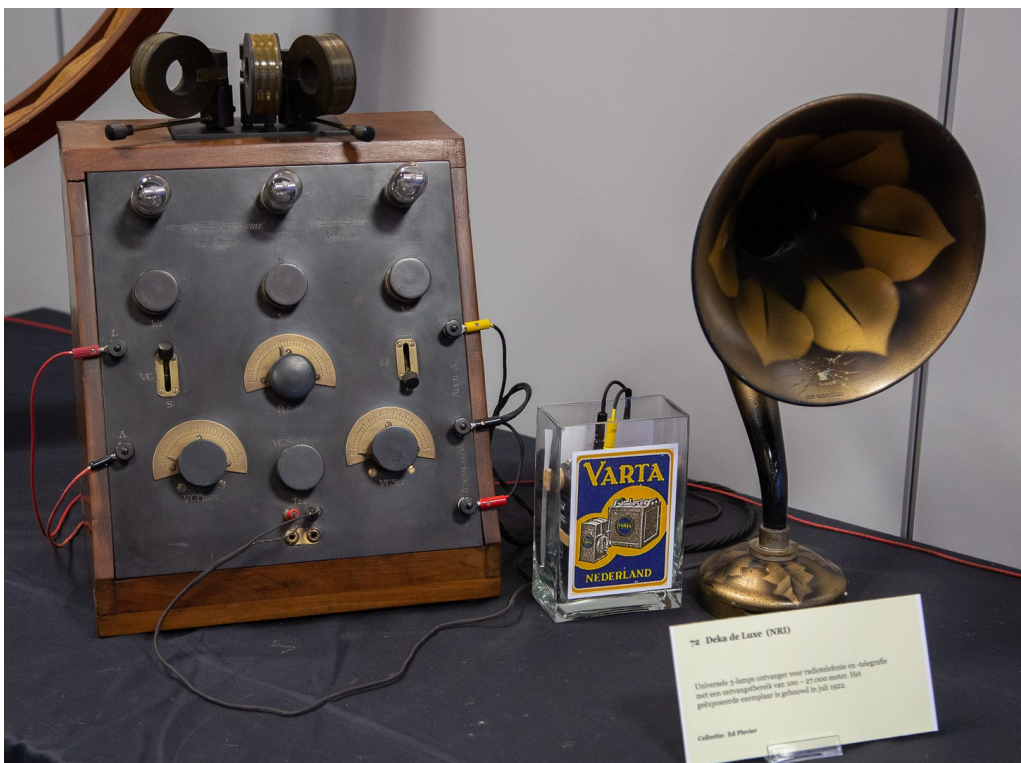
Uitgelicht: de Deka de Luxe van Ed Plevier met hoornluidspreker, die de muziek ten gehore bracht, die uitgezonden werd door de replica zender van Ed.